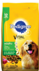
Pedigree Car/Veg-10,1 Kg R$ 74,90