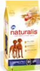
Naturalis AD. - 15 Kg R$ 104,90